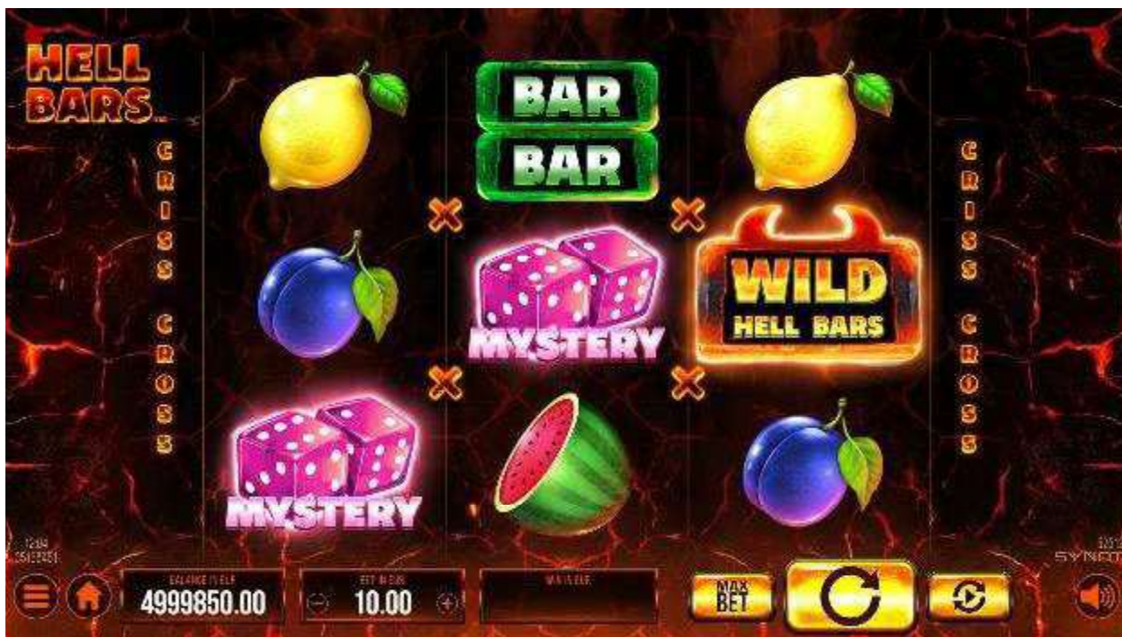
Panel Uživatelské rozhraní hry (UI) se nachází v dolní části obrazovky.