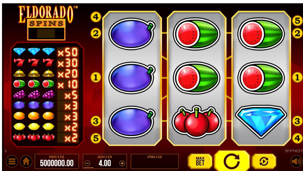
Panel Uživatelské rozhraní (UI) se nachází v dolní části obrazovky.