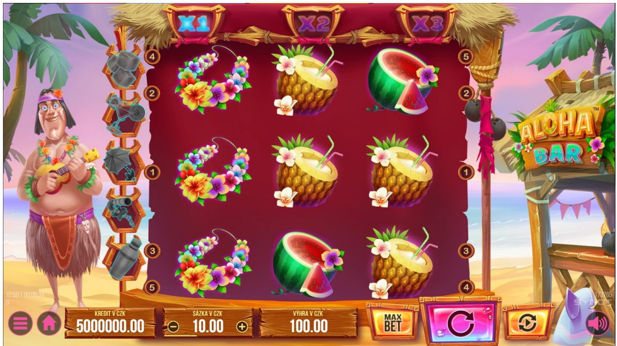
Panel Uživatelské rozhraní hry (UI) se nachází v dolní části obrazovky.