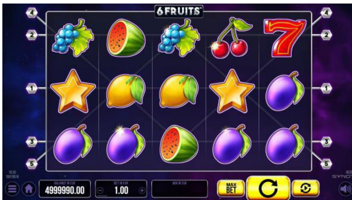
Panel Uživatelské rozhraní hry (UI) se nachází v dolní části obrazovky.