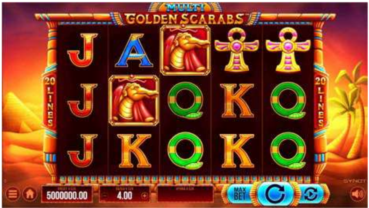
Panel Uživatelské rozhraní hry (UI) se nachází v dolní části obrazovky.